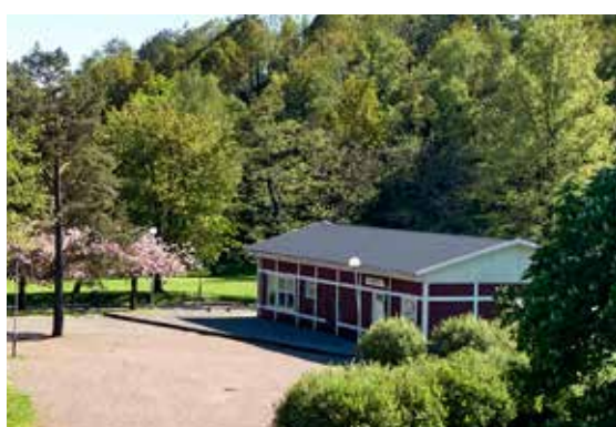
Fritidsklubben Diamanten ligger mitt i Dalen.