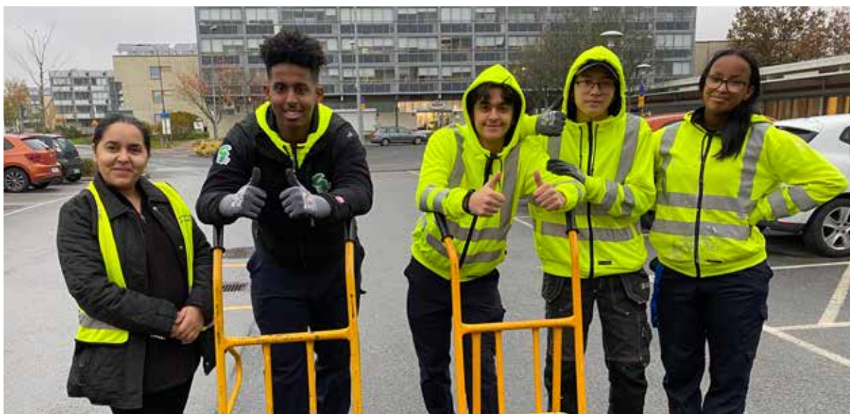
Höstlovsjobbare i Gårdsten.