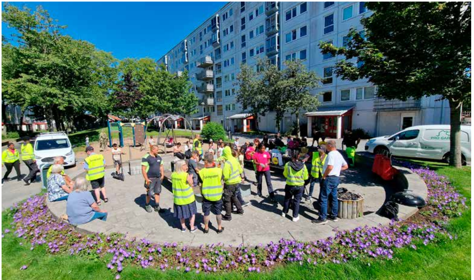
Grilldag på Salviagatan.