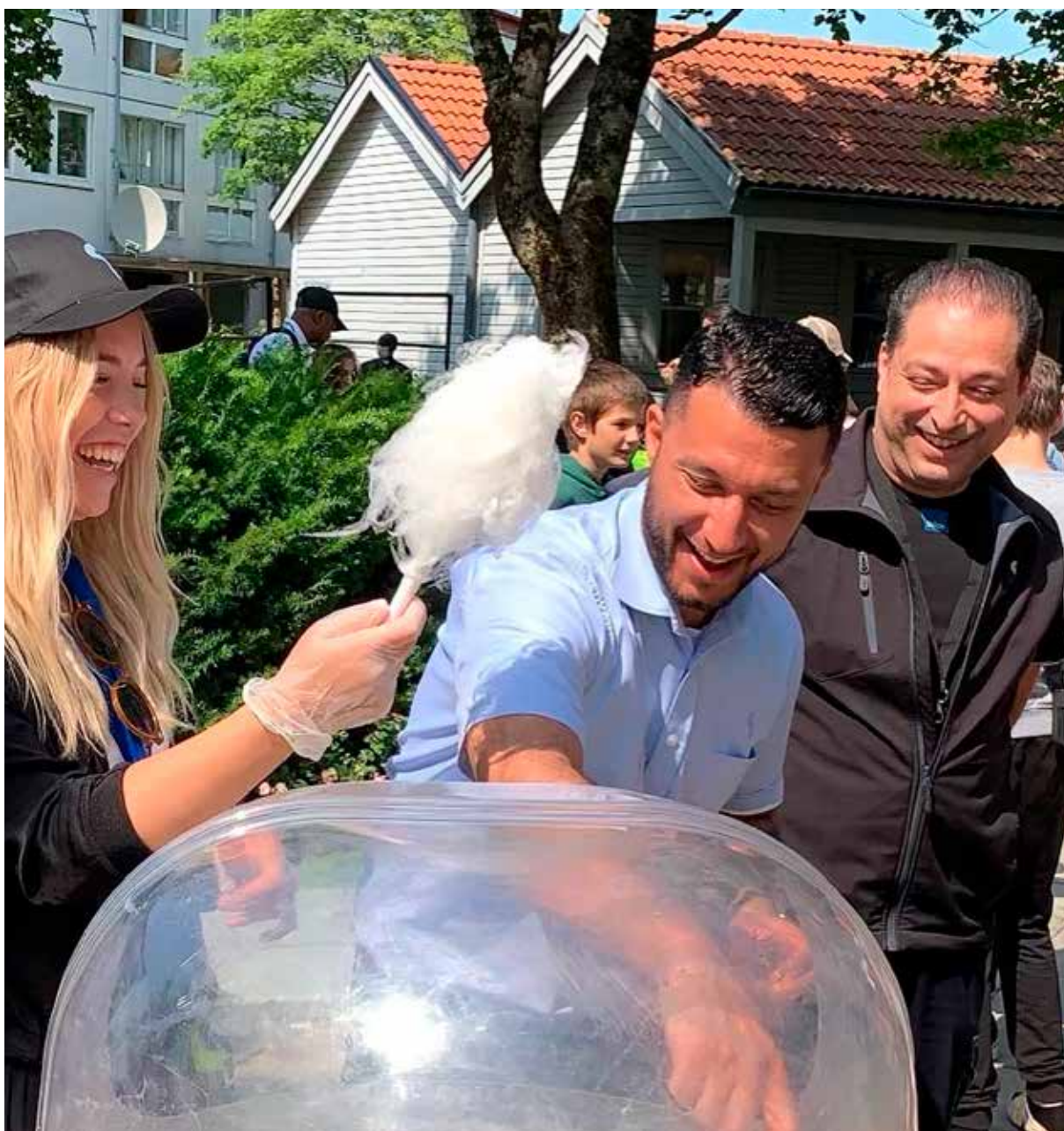
Hyresgästaktivitet i östra Gårdsten.

En ytterligare beskrivning av vårt ansvar för revisionen av årsredovisningen finns på Revisorsinspektionens webbplats: www.revisorsinspektionen.se/revisornsansvar . Denna beskrivning är en del av revisionsberättelsen.