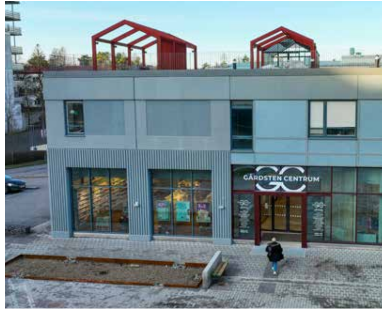
Nya entrén till Gårdsten Centrum vid Salviatorget.

Samtidigt pågår byggnationen av cirka 450 hyreslägenheter i Centrum. Det första projektet heter Kryddgården och omfattar 299 hyresrätter på 1-4 rum och kök. Inflyttningen startade under hösten och fortsätter under 2023. Det är företaget Serneke som bygger för 3e AP-fonden och Balder som kommer förvalta bostäderna. Byggnationen för andra projektet, som fått namnet Örtagården, är avbruten.