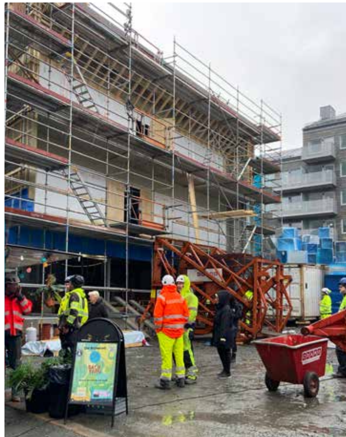
Taklagsfest för nya kontoret på Salviatorget.