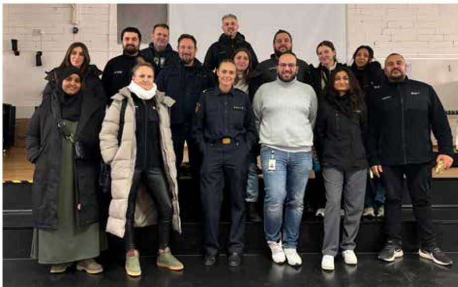
Med på bild finns representanter från Gårdstensbostäder, Polisen och Socialtjänsten Nordost.

Då har du möjlighet att diskutera mer kring trygghet med utställarna. Välkomna!