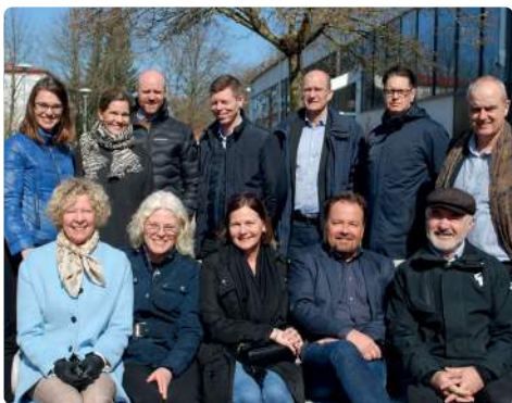
Swedbanks kontors- och områdeschefer på besök i Gårdsten.