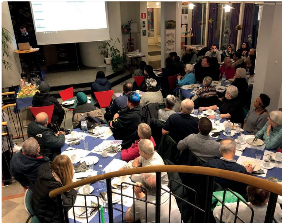
Nytt rekord med deltagare på bomöten med huscheferna.