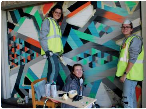
Spanska ungdomar målade i Gårdsten.