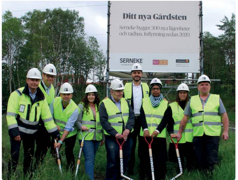
Första spadtag för förnyelsen av Gårdstens Centrum inom ramen för vision 2025.