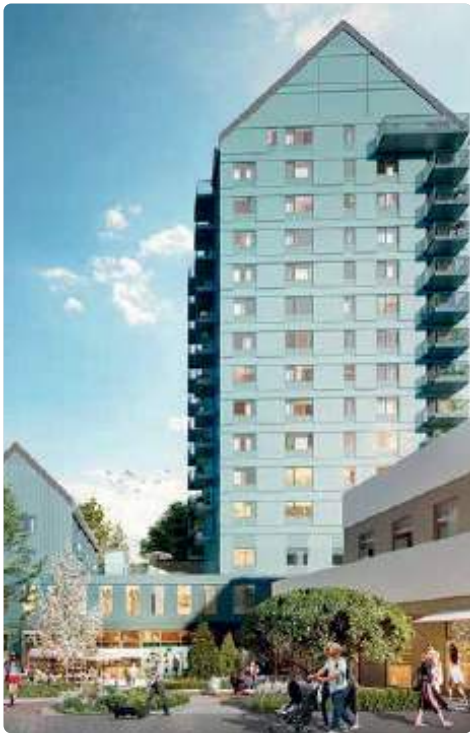
Byggnationen av Brf Utsikten i Gårdsten har nu fått startbesked. 59 nya bostadsrätter blir ett nytt och välkommet tillskott i en långsiktig satsning på stadsdelen.