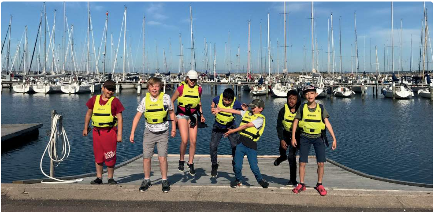
Seglarskola i samarbete med GKSS och Rotary Långedrag sedan 2005.