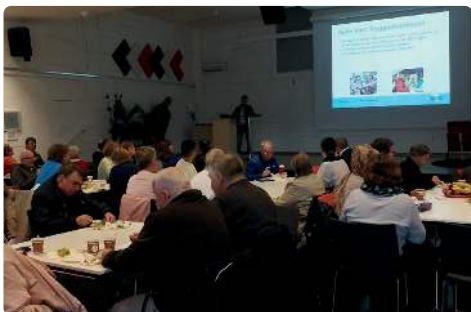
Många gårdstensbor besökte trygghetsmässan i april.