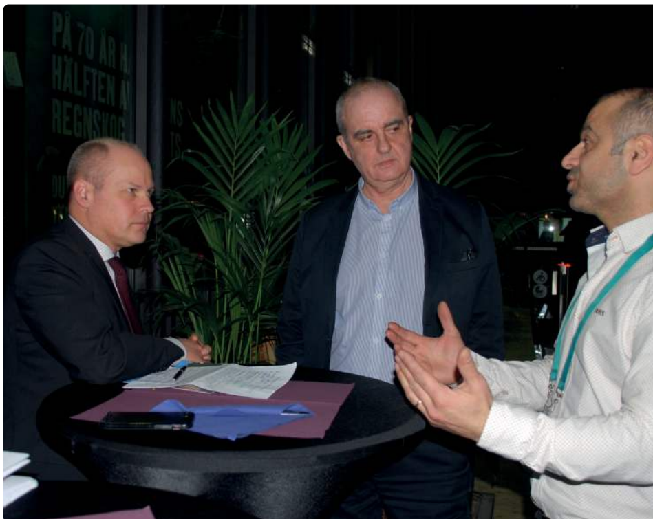
Möte med justitieministern på Universum i samband med Brottsförebyggande rådets nationella konferens.