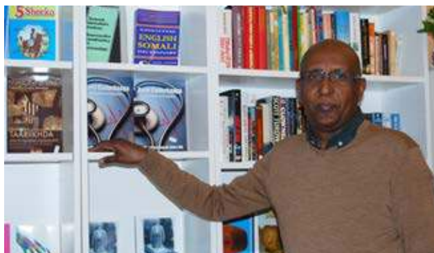
Ny bokhandel öppnade i Gårdstens Centrum – Shabeete Bookshop.