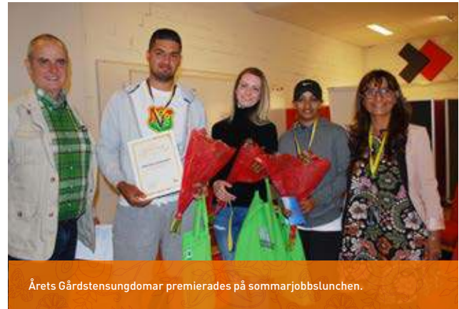
Årets Gårdstensungdomar premierades på sommarjobbslunchen.