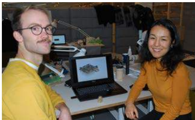
20 elever från Chalmers ritade förslag på hospice i Gårdsten. Deras presentation gjordes den 8 januari 2018.