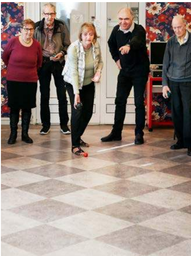
I seniorlokalen i Gårdstens Centrum arrangeras aktiviteter varje dag.