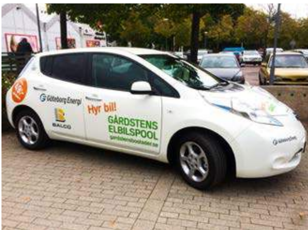
Den ena av elbilspoolens båda bilar har flyttat in i garaget på Kaneltorget.