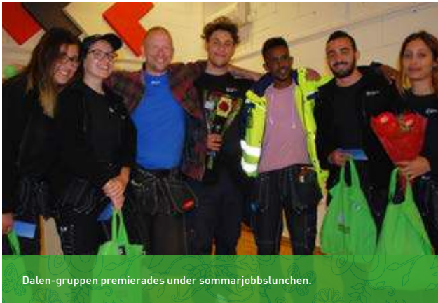
Dalen-gruppen premierades under sommarjobbslunchen.