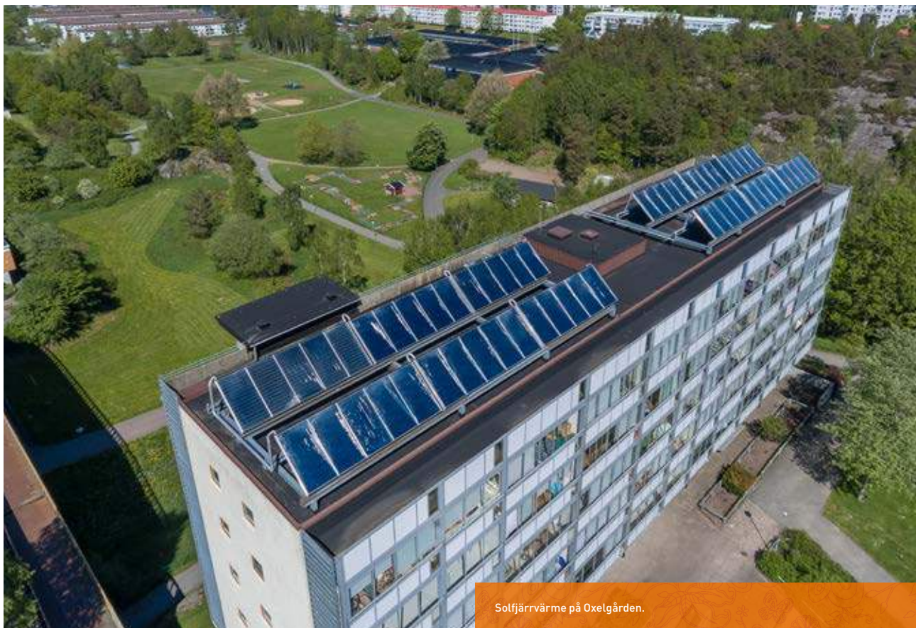
Solfjärrvärme på Oxelgården.