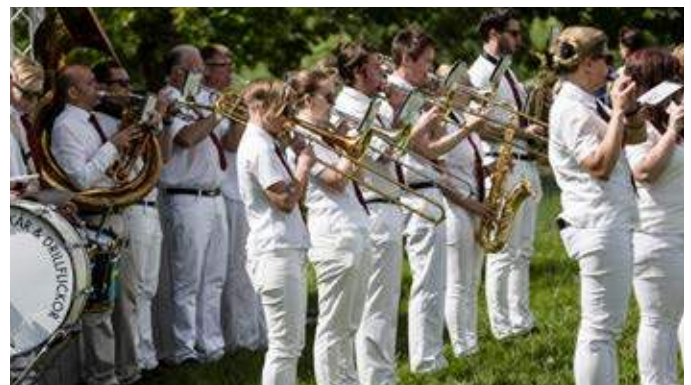
2017 firade Gärdstensbostäder 20-årsjubileum tillsammans med Gärdstensborna den 10 juni.