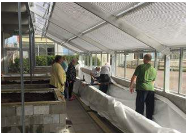
Nya växthuset på Lindgården invigdes.

Under året invigdes det nya växthuset på Lindgården. Det sista färdigställandet gjordes av 25 boende som bland annat fyllde växtbäddarna med jord.