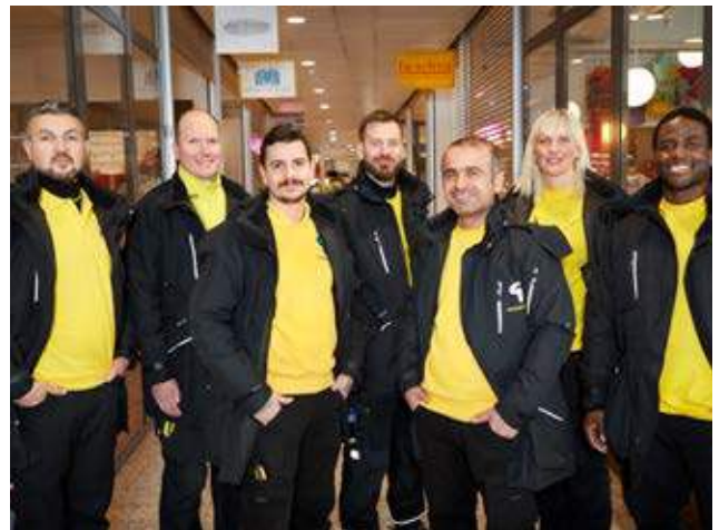
Trygghetsgruppen startade 2002 och arbetar 365 dagar om året.