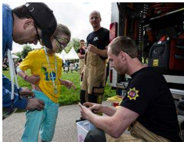
20-årsjubileet firades på Gårdstensdagen den 10 juni.