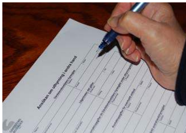
Genom arbetet med olovlig andrahandsuthyrning har 51 lägenheter kunnat frigöras.

Elbilspoolen har drivits under flera år med två bilar, den ena flyttade under våren in i garaget på Kaneltorget.