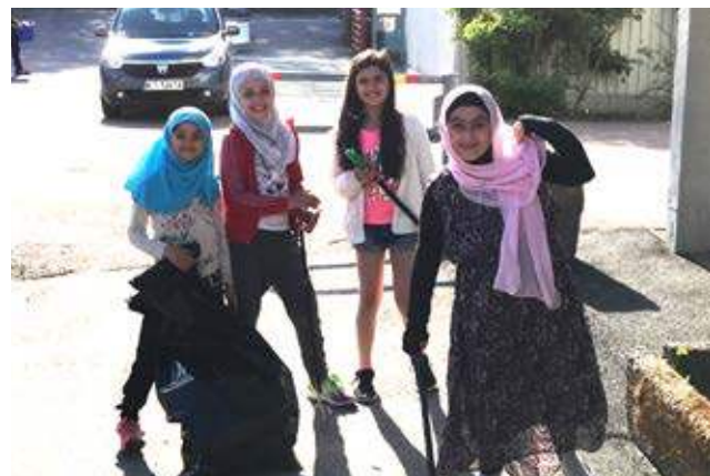
Flera städ- och planteringsdagar arrangerades i området under året.

I år arrangerades två städ- och planteringsdagar, den 25 maj i norra Gårdsten och den 17 i östra. Totalt hjälpte ett 70-tal hyresgäster till att göra fint; städa och plantera.