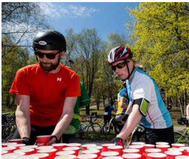
Samverkan med Göteborgsgirot innebar depåstopp i Gårdstensdalen för tredje året.