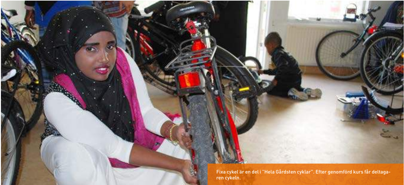
Fixa cykel är en del i "Hela Gårdsten cyklar". Efter genomförd kurs får deltagaren cykeln.