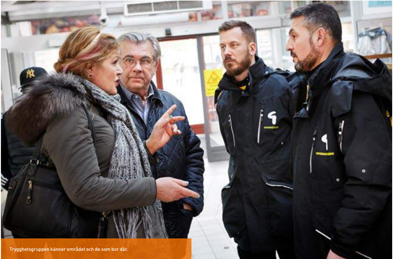
Trygghetsgruppen känner området och de som bor där.