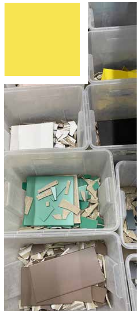
Kakelplattor i olika färger beställs från ▶ Tyskland.