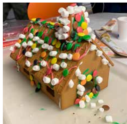
Många vackra hus blev det på Peppargatan.

Det var pyntat och fint i växthuset. Den 30 november ställde nämligen ett tiotal hyresgäster upp och monterade ljusslingor både på husens loftgångar samt i områdets två växthus. 🔄