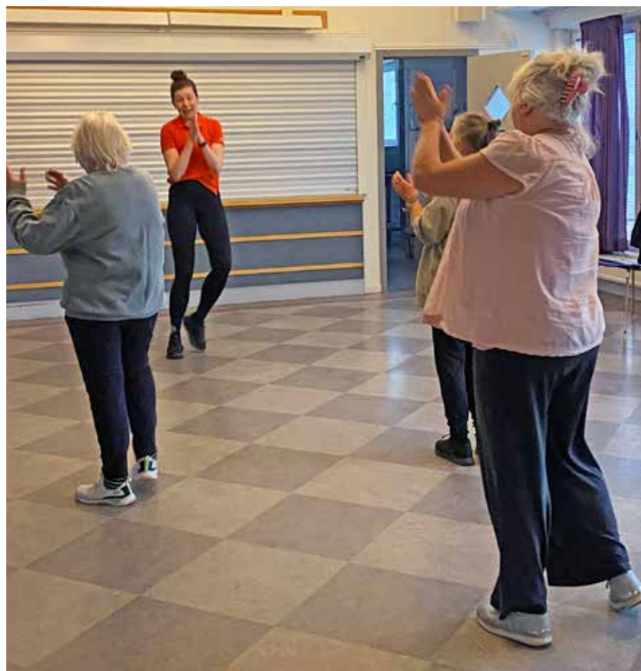
Dags att släppa loss med dansgympa i Seniorlokalen på Muskotgatan 10.

Därefter torsdagar, jämna veckor till den 15 maj. 📍