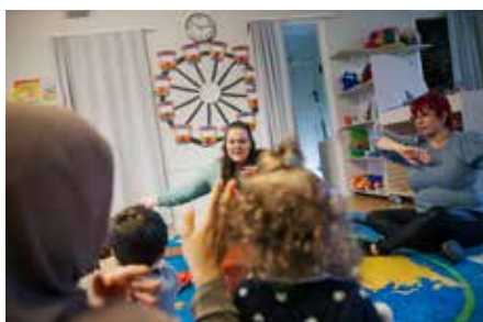
Sångstund på öppna förskolan Gårdsten