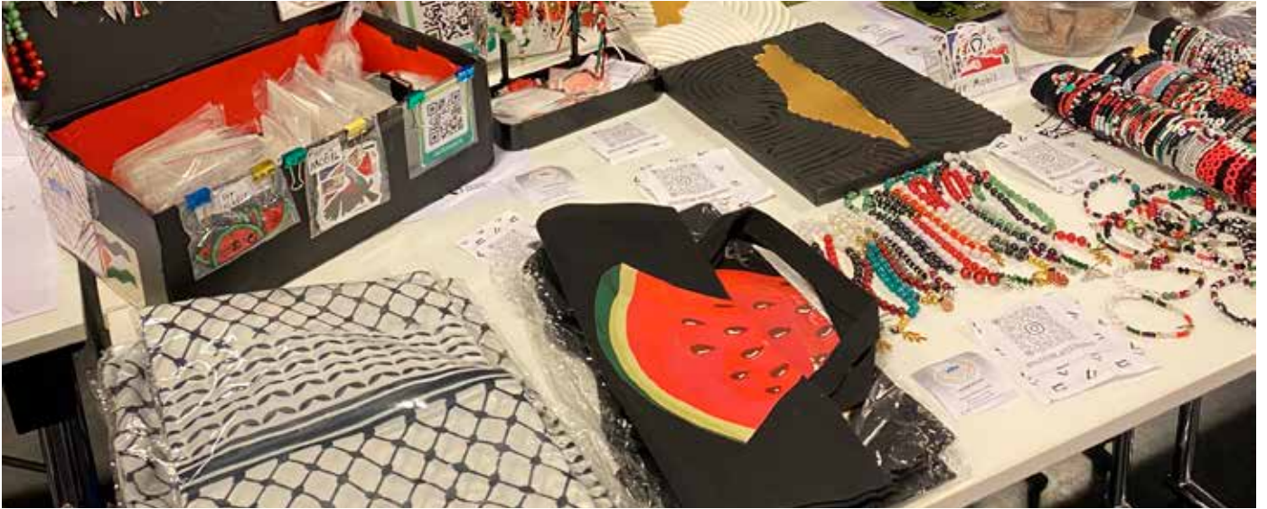
Unga entreprenörer och företag deltog på eventet i Idéum.