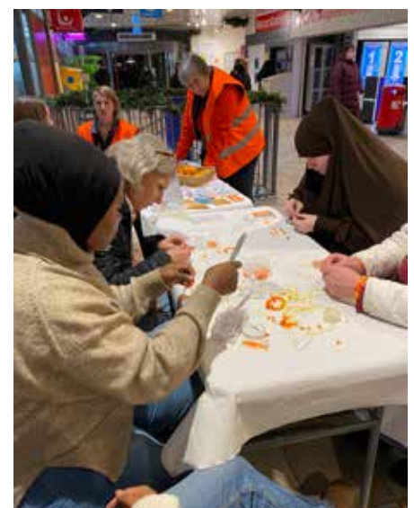
Det knöts många armband i Gårdsten Centrum.